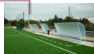
Bancs de touche et banc arbitre