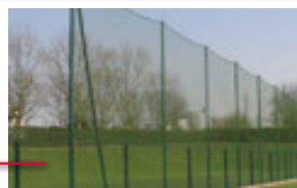
Pare ballon L=36m et H=6m