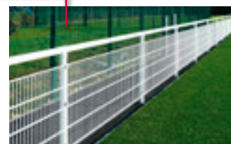
Garde Corps - Main courante